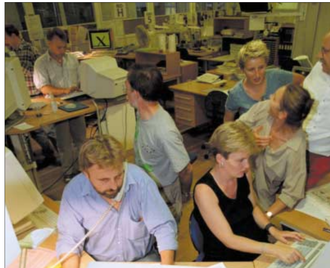
Et centralt mål med projektet er, at redaktionssekretærens rolle og placering generelt skal styrkes.