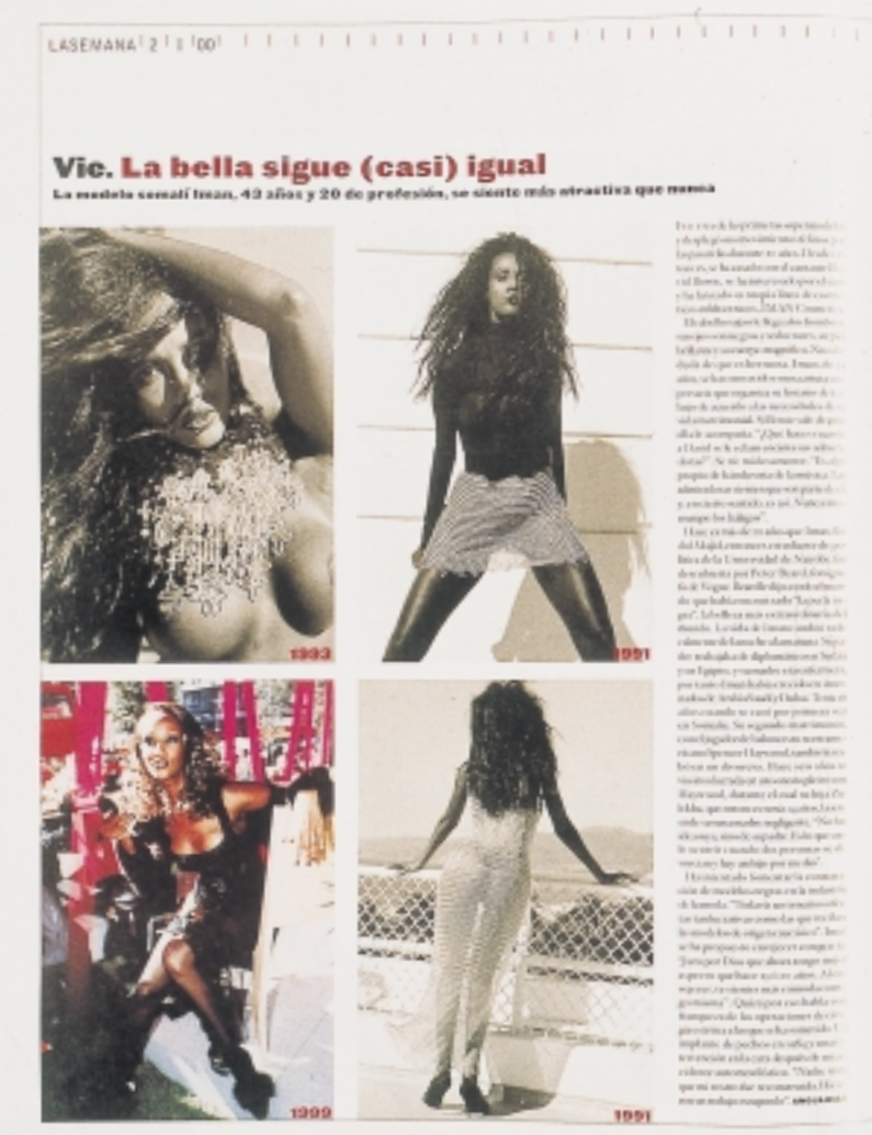
Der er knald på illustrationer og på farverne. Her et opslag fra El Mundo's Magazine

At spanierne er et sports-fanatisk folke- færd understreges af, at Marca rent faktisk er den avis i Spanien, der har det største oplag.