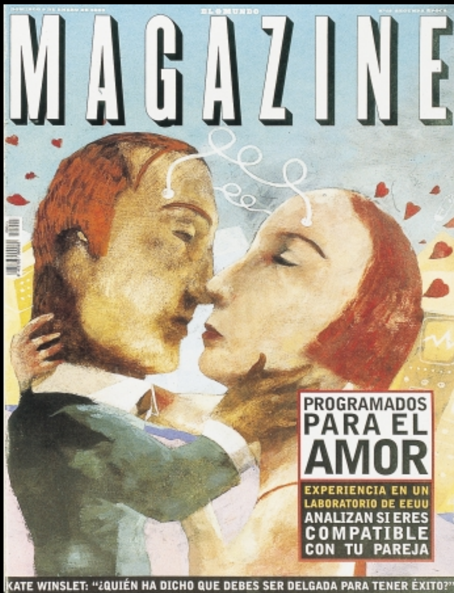
To af tillæggene til El Mundo – det ene målrettet mod kvinder. Det andet skifter fuldstændig stil fra uge til uge.