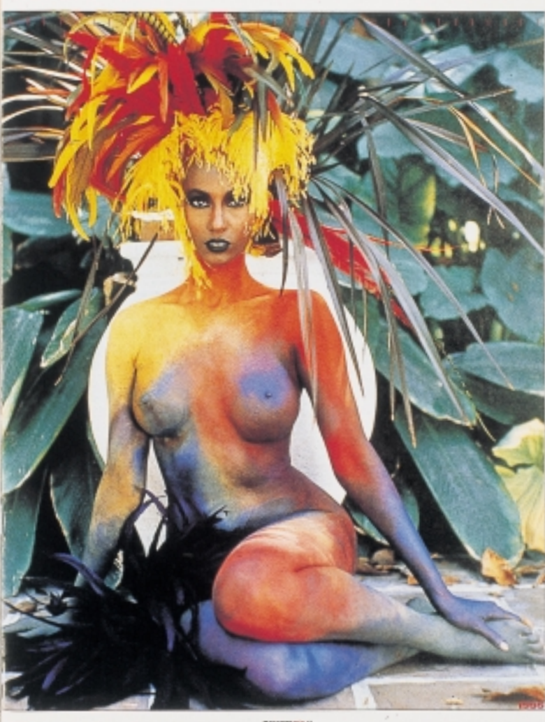
Der er knald på illustrationer og på farverne. Her et opslag fra El Mundo's Magazine